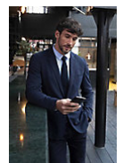
NEOBLU MARCEL MEN 03169